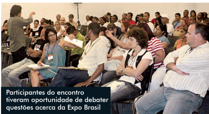
Participantes do encontro tiveram oportunidade de debater questões acerca da Expo Brasil