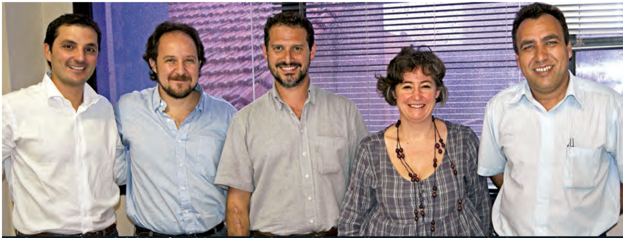
Delegação da Red del Sur faz visita a sede da UNISOL Brasil em São Bernardo do Campo, SP

Ano I ♦ Edição 06 ♦ Novembro-Dezembro/2010 ♦ Distribuição Gratuita ♦ Tiragem: 4 mil exemplares