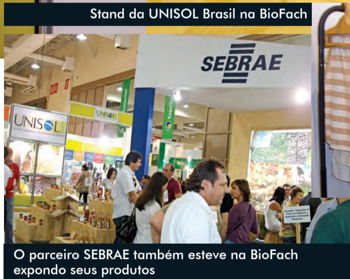
O parceiro SEBRAE também esteve na BioFach expondo seus produtos