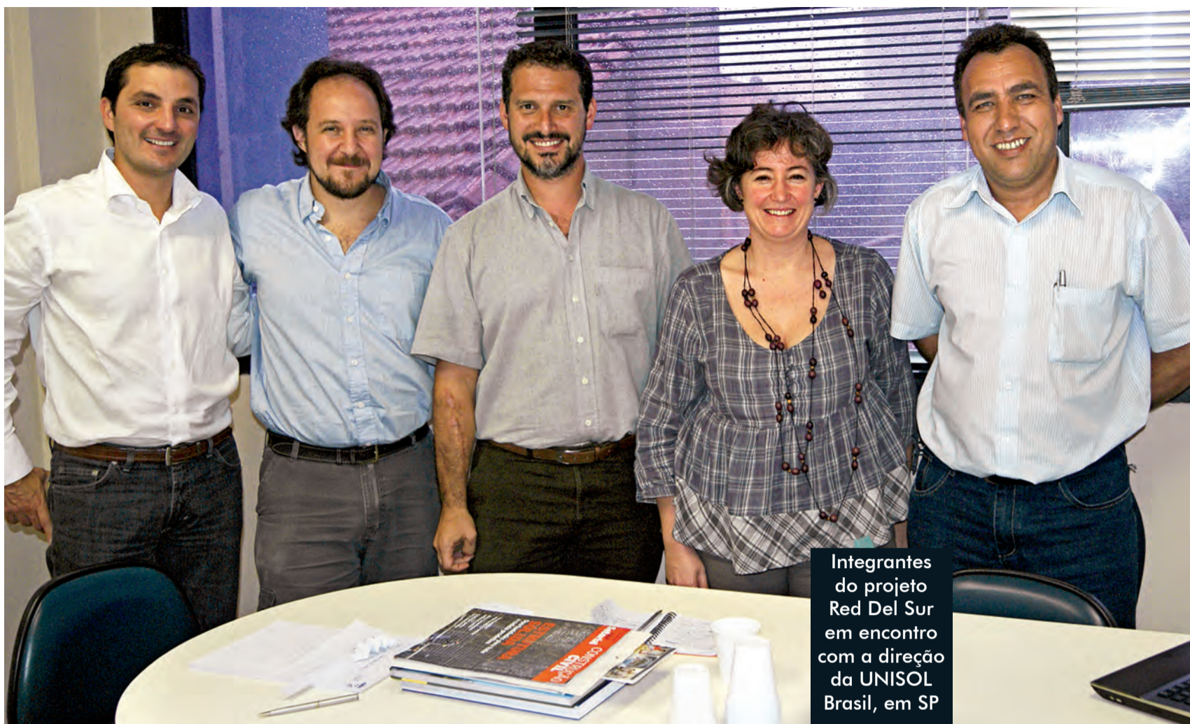
Integrantes do projeto Red Del Sur em encontro com a direção da UNISOL Brasil, em SP