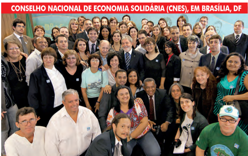
CONSELHO NACIONAL DE ECONOMIA SOLIDÁRIA (CNES), EM BRASÍLIA, DF Presidente Lula garante ao Brasil o primeiro Sistema de Comércio Justo e Solidário do mundo. Página 2

UNISOL Brasil leva stand à BioFach UNISOL Brasil leva stand à Bio-Fach, maior feira internacional de produtos orgânicos, realizada no Transamérica Expo Center em São Paulo. A central de empreendimentos expôs seus produtos e vídeos ao longo do evento, e contou com a presença de parceiros como SEBRAE e a Natural Fashion. Página 5