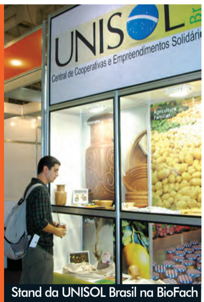
Stand da UNISOL Brasil na BioFach

UNISOL Brasil leva stand à BioFach UNISOL Brasil leva stand à Bio-Fach, maior feira internacional de produtos orgânicos, realizada no Transamérica Expo Center em São Paulo. A central de empreendimentos expôs seus produtos e vídeos ao longo do evento, e contou com a presença de parceiros como SEBRAE e a Natural Fashion. Página 5