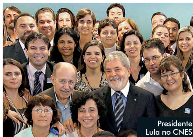
Presidente Lula no CNES