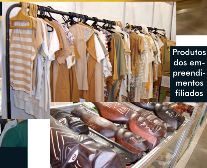
Produtos dos empreendimentos filiados