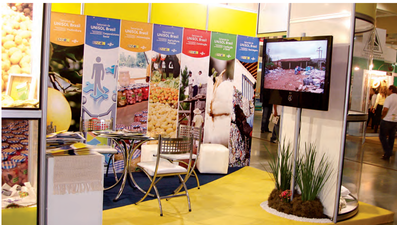
Stand da UNISOL Brasil na BioFach