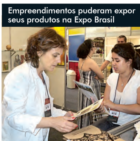
Empreendimentos puderam expor seus produtos na Expo Brasil