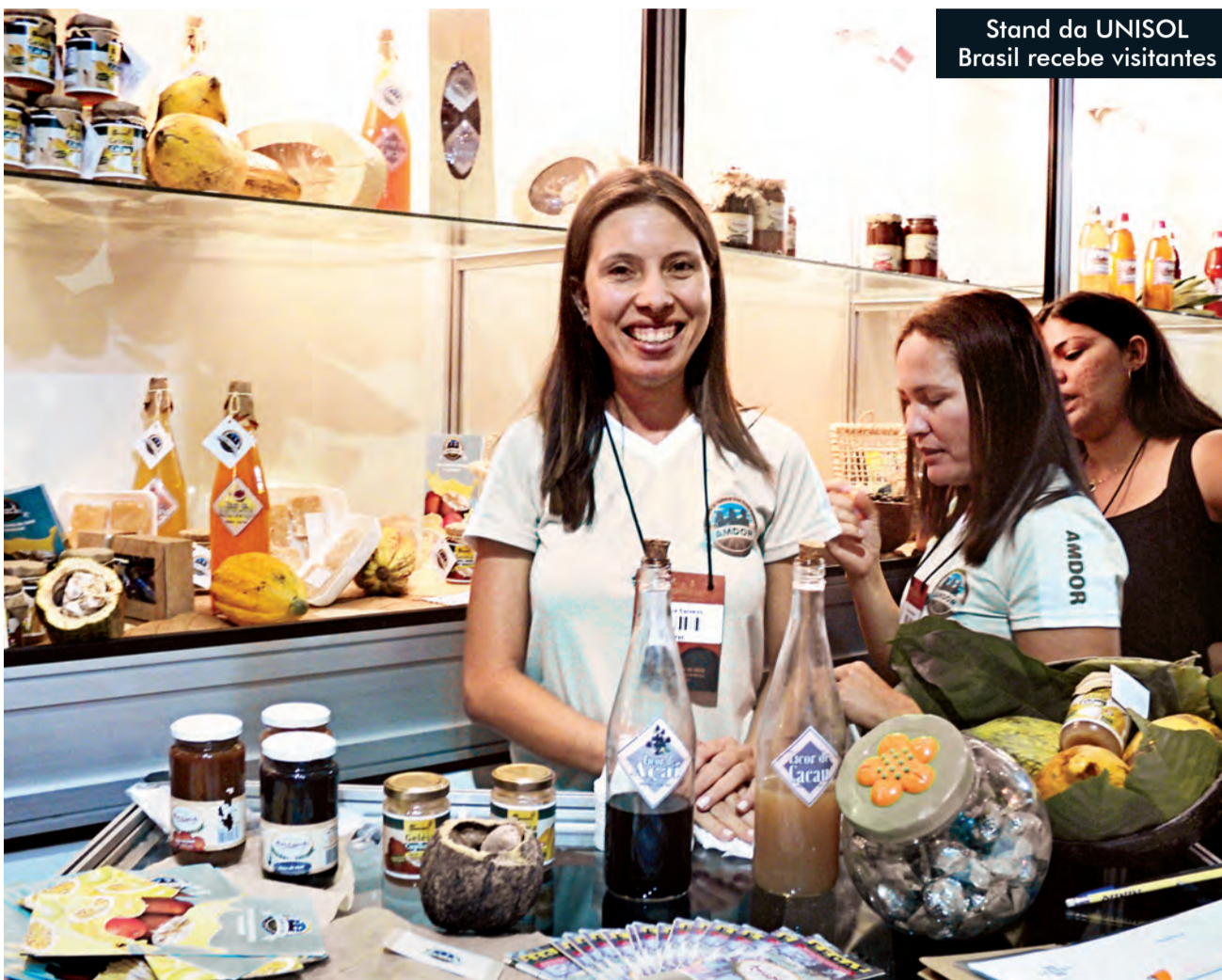
Stand da UNISOL Brasil recebe visitantes