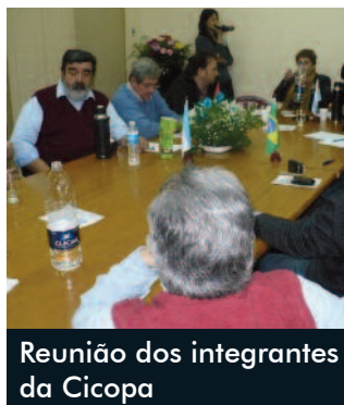
Reunião dos integrantes da Cicopa