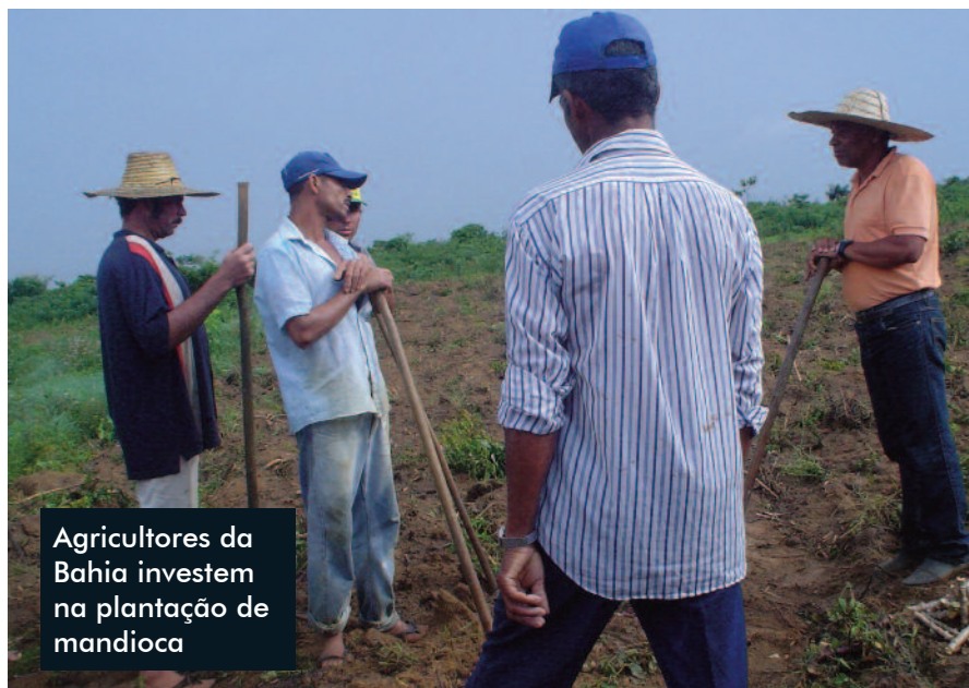
Agricultores da Bahia investem na plantação de mandioca